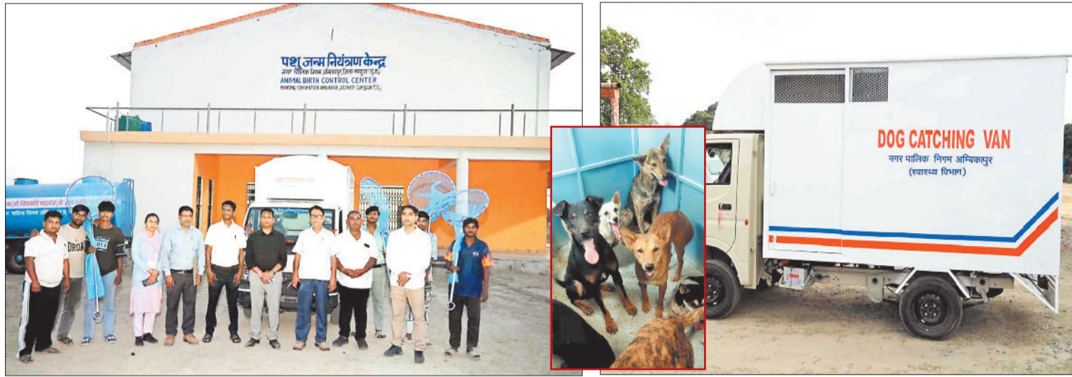
नविनिर्मित एनिमल बर्थ कंट्रोल सेंटर।

ननि ने उपलब्ध कराया आवश्यक संसाधन, एंजेसी साथ-साथ करेगी कुत्तों का प्रबंधन