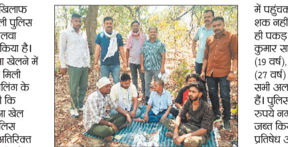
स्थल मुख्य मार्ग से लगभग एक किलोमीटर अंदर जंगल में स्थित था। पुलिस टीम ने गानगी वेशभूषा