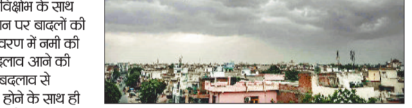
झारखण्ड एवं आसपास के क्षेत्रों में घटकाती परिसंचरण सक्रिय है। कर्नाटक से तिलिनाडु होते हुए एक दैगिका वहीं महाराष्ट्र में एक प्रति चकवात सक्रिय है।

अंबिकापुर। उत्तर भारत में सक्रिय पछुआ विशोम के साथ ही अन्य मौसमी घटकों के प्रभाव से आसमान पर बादलों की आवाजाही बढ़ गई है। मौसम विज्ञानी वातावरण में नमी की मात्रा बढ़ने के साथ ही मौसम में व्यापक बदलाव आने की संभावना व्यक्त कर रहे हैं। मौसम में आए बदलाव से आगामी तीन दिनों तक तापमान में गिरावट होने के साथ ही गर्मी से राहत मिलने की संभावना है। वर्तमान में उत्तर भारत में एक पछुआ विशोम सक्रिय है जिसके प्रभाव से मौसम में व्यापक बदलाव आया है तथा पूर्वी उत्तर प्रदेश, पूर्वी