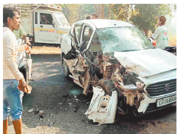
दुर्घटना में क्षतिग्रस्त कार।

लटोरी चौकी क्षेत्र में रिवार सुबह अनियंत्रित रफ्तार की पिकअप वाहन और मारुति स्विफ्ट डिजायर कार की आमने सामने टक्कर हो गई जिसमें कार के साइड का हिस्सा बुरी तरह क्षतिग्रस्त हो गया है। प्रजापत जानकारी अनुसार स्विफ्ट डिजायर कार क्रमांक सीजी 13 एए 5588 एवं पिकअप क्रमांक सीजी 04 व्यू डब्लू 2844 की ग्राम कल्याणपुर के समीप प्रातः आमने सामने टक्कर हो गई जिसमें स्विफ्ट कार चालक युवक को गंभीर घायल अवस्था में स्थानीय ग्रामीणों की मदद से अम्बिकापुर अस्पताल इलाज हेतु भर्ती कराया गया है। देर शाम तक किसी भी पक्ष