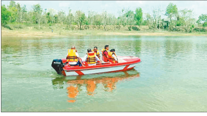
बोट का आनंद लेते नगर के लोग।

जिले के प्रमुख पर्यटन स्थलों में शामिल रामानुजगंज वन वाटिका इन दिनों नए आकर्षणों के कारण पर्यटकों की पहली पसंद बनती जा रही है। यहां लंबे अंतराल के बाद बोटिंग सुविधा फिर से शुरू की गई है, वहीं बच्चों के लिए आधुनिक चिल्ड्रन पार्क का भी विकास किया गया है। इन नई सुविधाओं के शुरू होने से क्षेत्र में पर्यटकों की संख्या में उल्लेखनीय वृद्धि देखी जा रही है। करीब 12 वर्षों के बाद वाटिका में दोबारा नौकायन शुरू होने से पर्यटकों में